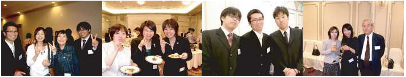
おい、みんな元気か〜♪