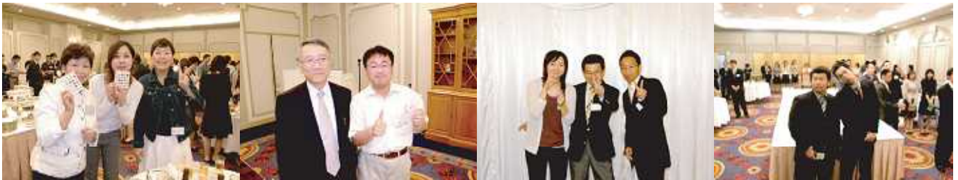
2007年6月9日 — 平成19年度ひのくま会総会