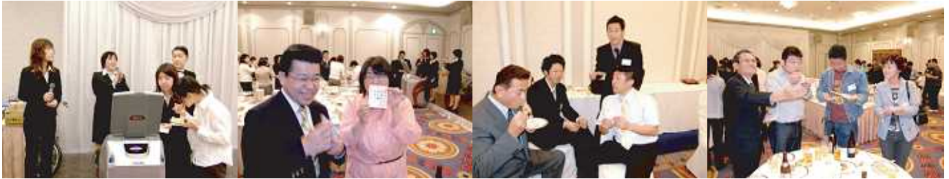
この機会に同窓生や先輩、後輩を誘って会いませんか？